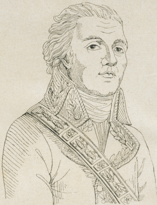
Le G al Dugommier