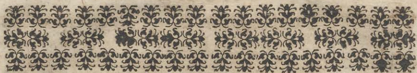
TABLE DES CHAPITRES DES TROIS LIVRES DE CE VOYAGE.